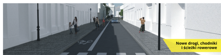
Nowe drogi, chodniki i ścieżki rowerowe