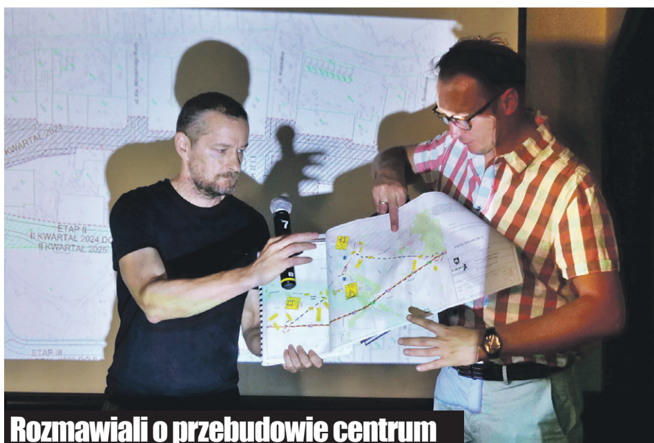
Rozmawiali o przebudowie centrum