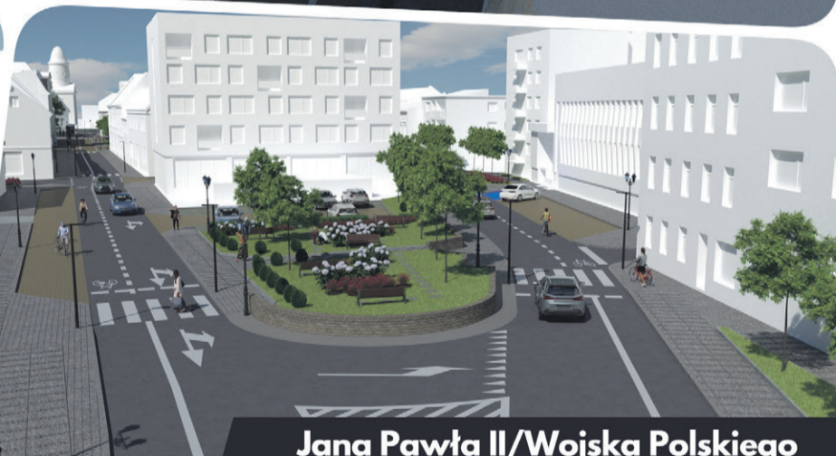
Jana Pawła II/Wojska Polskiego