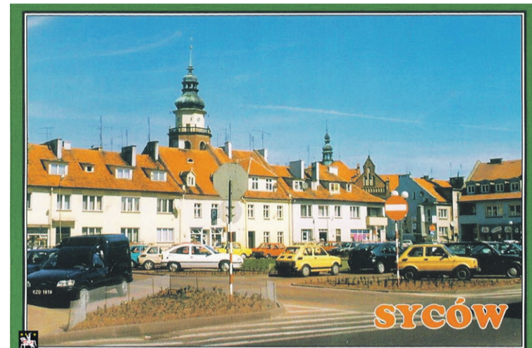
Rynek w czasach „małych fiatów”

w ręce Armii Czerwonej. W tym czasie Syców został częściowo zniszczony, a ratusz i zamek podpalono. Polskie władze komunistyczne podjęły decyzję o rozbiór-