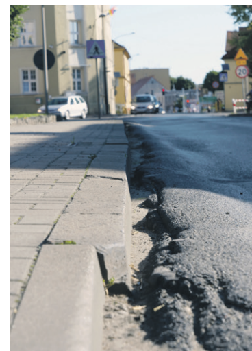
Jana Pawła II i Szkolna - tutaj będzie zupełnie inaczej