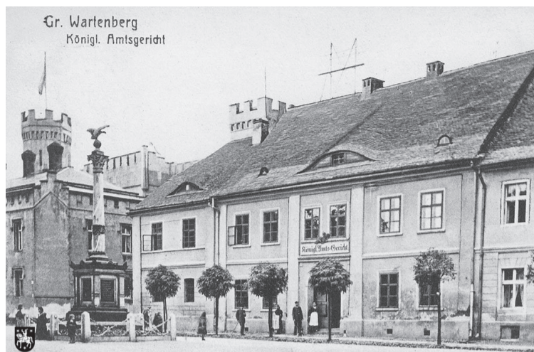
Dawny Syców utrwaliły stare pocztówki

- Nie wiadomo, kiedy powstał i jak wyglądał pierwotny, średniowieczny ratusz w Sycowie. Ze źródeł wynika, że do 1734 roku posiadał wieżę, która została z czasem rozebrana. Sam budynek spłonął w wyniku wielkiego pożaru w 1742 roku. W XVIII wieku powstał kolejny ratusz, z którego w 1792 roku usunięto wieżę i zastąpiono hełmem nasadzonym – wyjaśnia