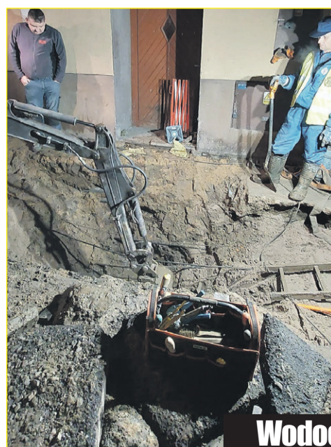
Wodociągi muszą przejść remont