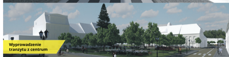
Wyprowadzenie tranzytu z centrum