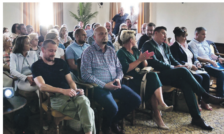
Mieszkańcy mogli wyrazić swoją opinię

- Metamorfoza centrum miasta przyniesie blisko 3000 m 2 przestrzeni zielonej, tworząc przyjemne